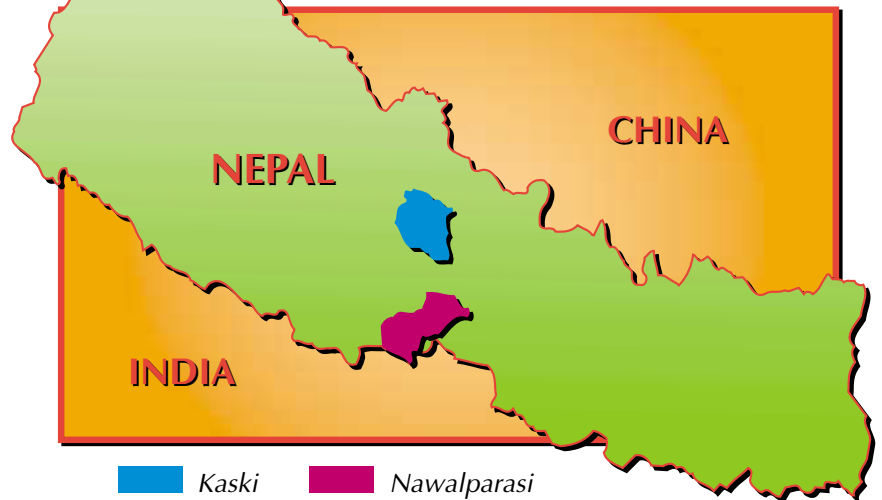
Gráfico 1: Los dos distritos del estudio: el Distrito de Kaski se clasifica como sierra, mientras que el Distrito de Nawalparasi, al sur, es más llano y tiene bosques densos de alto valor

La silvicultura comunitaria es una forma de manejo forestal participativo que permite a las poblaciones locales manejar y utilizar los recursos forestales locales para satisfacer sus necesidades básicas. En Nepal, se la ha aplicado en una diversidad de situaciones, desde pequeños lotes boscosos degradados en las sierras hasta bosques densos maduros y abundantes de la región baja del Terai.