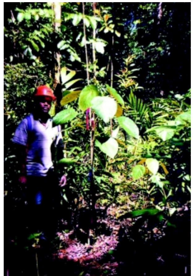
Regeneración natural de tulipero seis meses después de la extracción llevada a cabo conforme al Código de prácticas de aprovechamiento forestal en el bosque de demostración de Forari, Isla Efate, Vanuatu.

Casi un tercio del territorio de Vanuatu está cubierto de bosques de más de 10 metros de altura, que comprenden 205.000 hectáreas de bosque medio (>20 metros de altura) y 234.000 hectáreas de bosque bajo. Un inventario forestal nacional realizado en 1993 reveló un volumen total de recursos maderables de aproximadamente 13 millones de metros cúbicos. Sin embargo, sólo el 20 por ciento del recurso total se considera de valor comercial debido a factores tales como pendientes abruptas, topografías fragmentadas, bajos volúmenes de trozas para aserrío, o restricciones culturales.