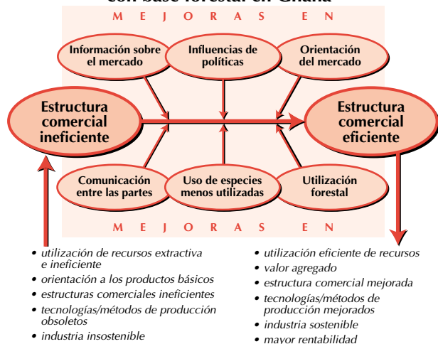
Gráfico 1: Factores requeridos para la transición hacia una estructura comercial eficiente con base forestal en Ghana

Para más información, dirigirse a: OAB, BP 1077, Libreville, Gabón; Fax: 241-73 4030; Email: oab-gabon@internetgabon.com; ver asimismo en la página 3 una decisión aprobada por el Consejo Internacional de las Maderas Tropicales en su último período de sesiones.