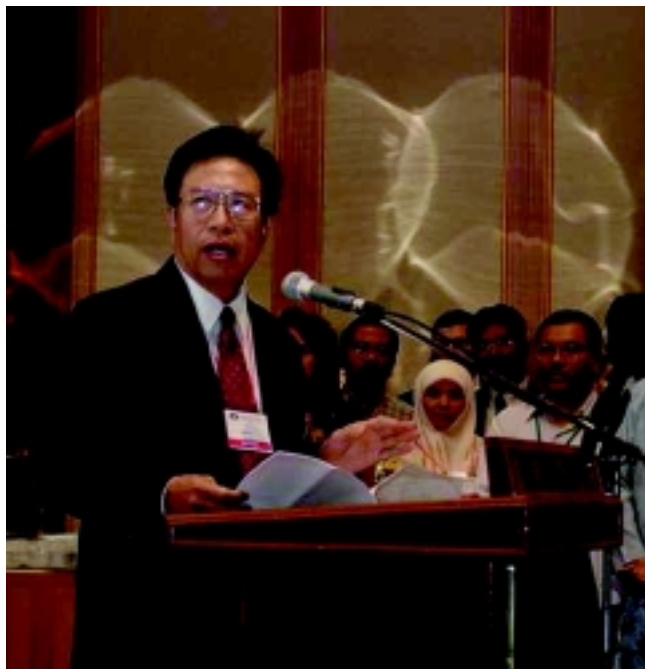
Datuk Haron durante el lanzamiento de una serie de publicaciones financiadas por la OIMT en el Congreso Mundial de la UIOIF celebrado en agosto (ver la pág. 24 para una descripción más detallada del lanzamiento).

Datuk Haron: Bueno, sin duda hemos avanzado mucho, aunque aún nos queda más por hacer. Ya se logró la concientización: la nación entera es totalmente consciente de la necesidad de asegurar la ordenación forestal sostenible. En segundo lugar, estamos tomando medidas sobre el terreno. Alrededor del 58 por ciento de nuestro país está cubierto por bosques naturales, algunos de los cuales se han asignado para la producción de madera y otros para la protección. Los bosques de producción se explotarán de forma sostenible, pero nadie puede tocar los bosques de protección ni extraer nada de esas zonas. Estamos haciendo cumplir estas restricciones.