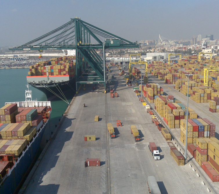
Puerto de Valencia, España. Las autoridades aduaneras del puerto de ingreso a la UE verifican las licencias FLEGT. Conforme al EUTR, la madera con una licencia válida automáticamente se considera legal.

cuestión; e indicadores para medir las actitudes cambiantes frente a la madera proveniente del país específico después de la aplicación de la licencia FLEGT.