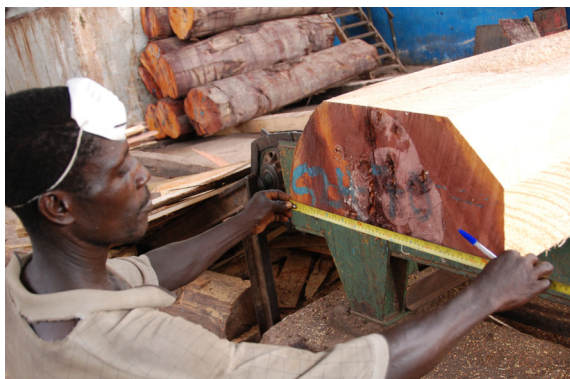
Mesurage du bois dans une scierie au Ghana – améliorer la qualité des données à toutes les étapes de la chaîne d'approvisionnement constitue une partie cruciale du processus APV-FLEGT.

L'OIBT a nommé un Consultant principal qui, basé en Europe, est chargé d'élaborer des plans de travaux et de coordonner le recueil de données et leur analyse. Afin de se mettre en phase avec les objectifs de la SIM, l'OIBT s'emploie à élargir sa capacité, implantée au Japon, en analyse des statistiques et données. S'appuyant sur le réseau de l'OIBT présent dans les pays où sont opérés des échanges commerciaux de bois tropicaux, le mécanisme SIM met en place des correspondants dans chacun des pays partenaires d'un APV et, en priorité, sur les marchés des bois sous autorisation FLEGT au sein de l'UE. Ces correspondants sont chargés de recueillir régulièrement des données et d'évaluer les conditions du marché et les prix des produits.