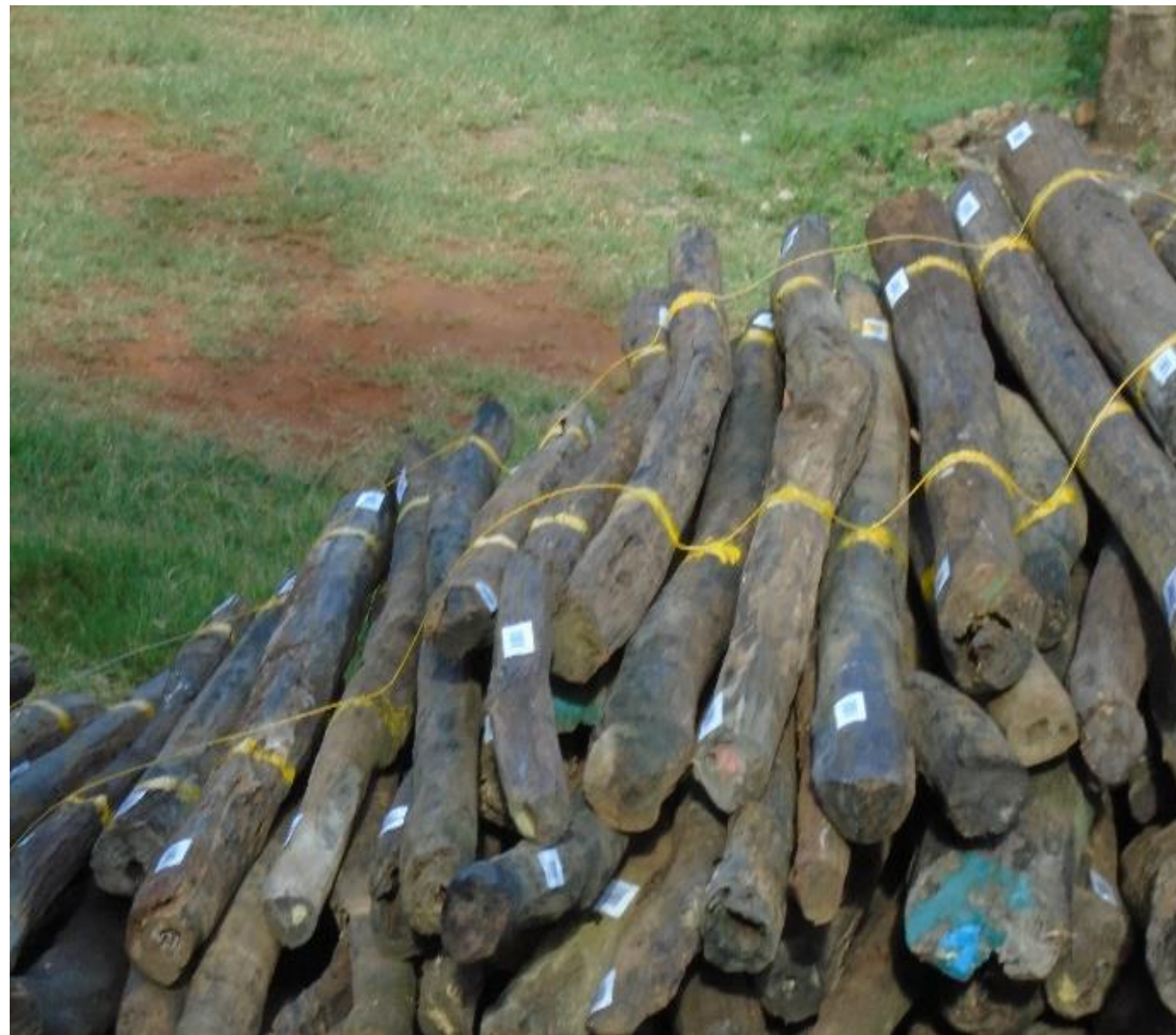
BDR étiquetés marqués et scellés