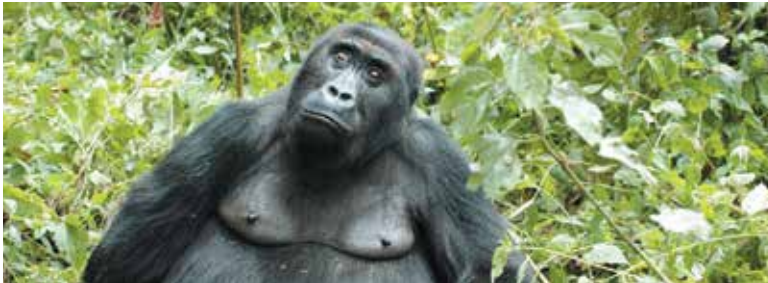
Un gorila del Parque Nacional de Kahuzi-Biega, República Democrática del Congo.

EL TRABAJO DE LA OIMT CONTRIBUYÓ A AUMENTAR EN UN 50% LA SUPERFICIE DE BOSQUES TROPICALES BAJO MANEJO SOSTENIBLE ENTRE 2005 Y 2010.