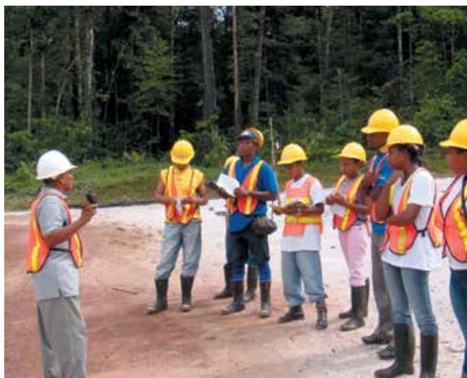
Des forestiers professionnels suivent une formation au Centre de formation forestière (FTCI) au Guyana.

L'OIBT OFFRE LA SOURCE DE DONNÉES ET STATISTIQUES LA PLUS COMPLÈTE AU MONDE SUR LA PRODUCTION ET LE COMMERCE DES BOIS TROPICAUX DANS SON EXAMEN BIENNAL ET ÉVALUATION DE LA SITUATION MONDIALE DES BOIS 1 , QUI EST DIFFUSÉ AUPRÈS DE PLUS DE 3 000 LECTEURS ET ENREGISTRE PLUS DE 6 000 CONSULTATIONS PAR AN SUR NOTRE SITE INTERNET.