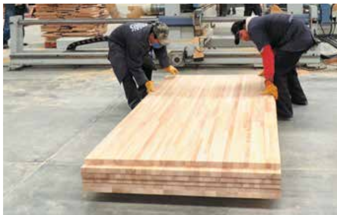
Une exploitation industrielle du bois détenue par la collectivité dans l'État d'Oaxaca au Mexique.

LE RAPPORT SUR LE MARCHÉ DES BOIS TROPICAUX (TTM) 2 , QUI EST TRANSMIS BIMENSUELLEMENT À 12 000 ABONNÉS, INFORME SUR LES TENDANCES DU MARCHÉ DU BOIS ET L'ACTUALITÉ DU COMMERCE DANS LE MONDE, Y COMPRIS LES PRIX INDICATIFS DE PLUS DE 400 ESSENCES ET PRODUITS À VALEUR AJOUTÉE D'ORIGINE TROPICALE.