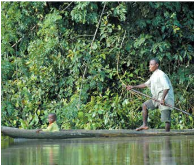
Un mode de transport local sur le fleuve Dzanga en République du Congo.

LES TRAVAUX DE L'OIBT AMÉLIORENT LA GOUVERNANCE FORESTIÈRE TOUT AU LONG DE LA CHAÎNE DE VALEUR, DEPUIS LES COMMUNAUTÉS ET INDUSTRIES LOCALES JUSQU' AUX GOUVERNEMENTS NATIONAUX ET CONSOMMATEURS INTERNATIONAUX, EN VALORISANT UNE DIRECTION ÉCLAIRÉE ET EN AMÉLIORANT LA TRANSPARENCE.