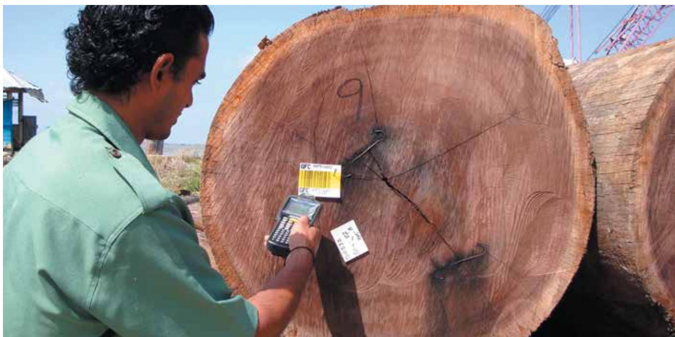
La traçabilité du bois au Guyana.