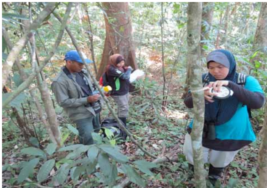
Mantenimiento de etiquetas y remediación de cada espécimen de Aquilaria malaccensis para el estudio demográfico en Malasia.

A la fecha, se emprendieron iniciativas para estudiar la ecología reproductiva de Aquilaria malaccensis , en las que se analizaron datos sobre la fenología de floración, madurez fisiológica y antesis/receptividad. Ahora las tareas se concentran en los trabajos de germinación y el establecimiento de parcelas provisorias para estudiar los patrones de