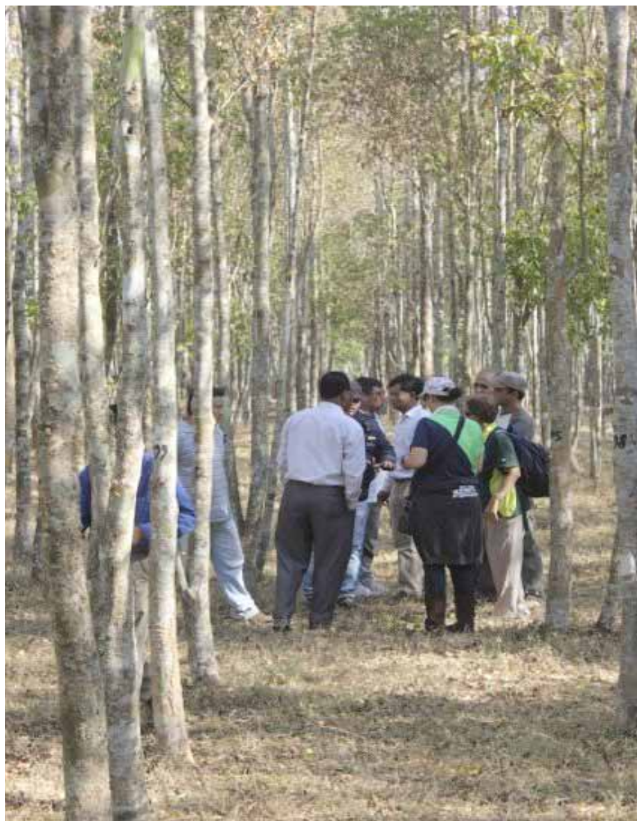
Los participantes del taller inspeccionan una plantación de madera de agar durante una visita en el noreste de Assam.

La madera de agar es un duramen resinoso aromático producido por una infección micótica en ciertas especies arbóreas,