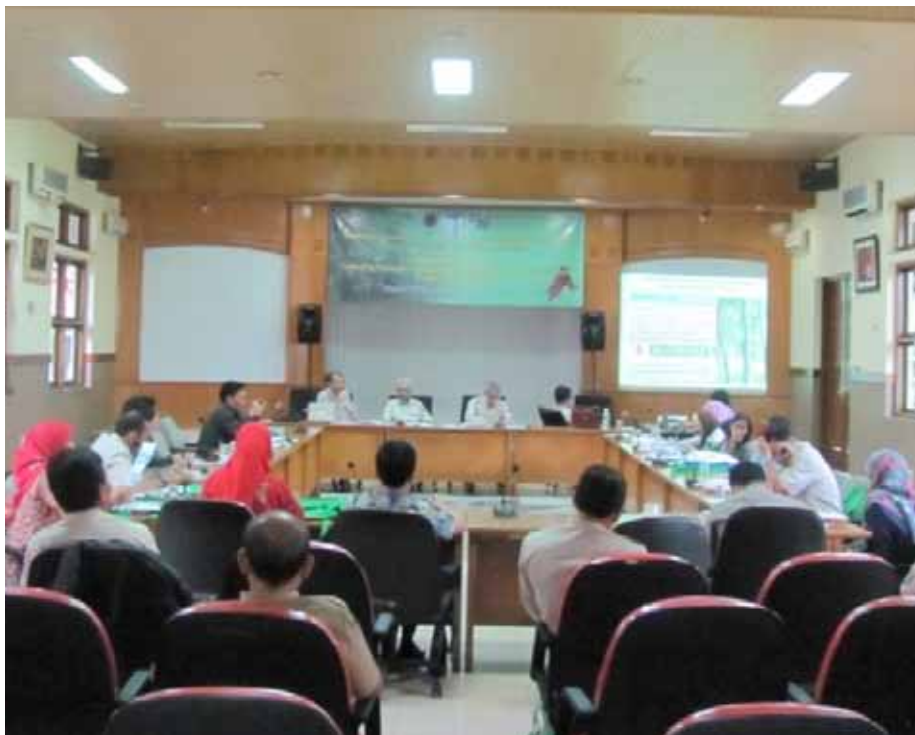
Deliberaciones durante el taller sobre manejo de plantaciones, producción y comercio de madera de agar, celebrado en Bogor, Indonesia.

En total, se prepararon siete informes a través de la actividad, a saber: (i) Manejo de plantaciones de madera de agar en Indonesia – Documentación de plantaciones de madera de agar; (ii) Desarrollo de un mecanismo de registro desde la plantación hasta la producción y comercio de madera de agar; (iii) Manejo de plantaciones de madera de agar en Indonesia