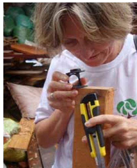
Una especialista en anatomía de la madera realiza la identificación de la madera aserrada antes de aplicar la técnica NIRS en un aserradero de Brasilia, Brasil.

El 19 de marzo de 2015, se llevó a cabo un segundo ensayo piloto en dos aserraderos de Brasilia, durante la visita del Sr. Ian Thompson (que realizó la evaluación intermedia del Programa OIMT-CITES) y el Coordinador Regional de América Latina. Se ensayaron el espectrofotómetro portátil y el modelo estadístico para las especies Cedrela odorata , Erisma uncinatum , Micropholis melinoniana y Swietenia macrophylla , y se obtuvieron muy buenos resultados en la diferenciación de la madera aserrada del ensayo.