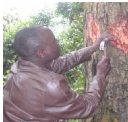
Un estudiante obtiene una muestra de ADN (de corteza y cámbium) de un árbol de Prunus en Kivu Norte, RDC, enero de 2015.