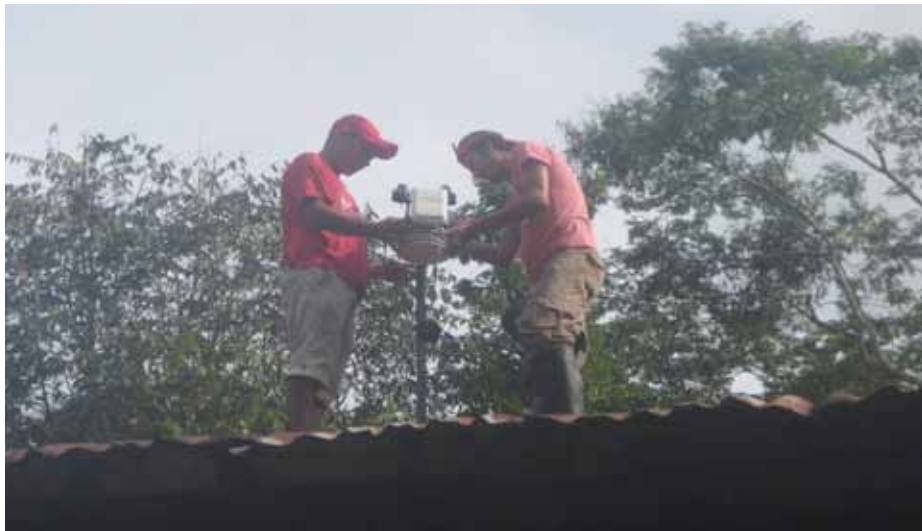
Instalación de la estación meteorológica portátil en el campamento de San Miguel de la concesión forestal del Rodal Semillero Tahuamanu.

Además, se instaló una estación meteorológica portátil que permitirá reunir datos sobre la temperatura, precipitaciones, radiación solar y dirección/velocidad del viento. Los datos diarios son registrados automáticamente, lo que contribuirá al estudio de la distribución y