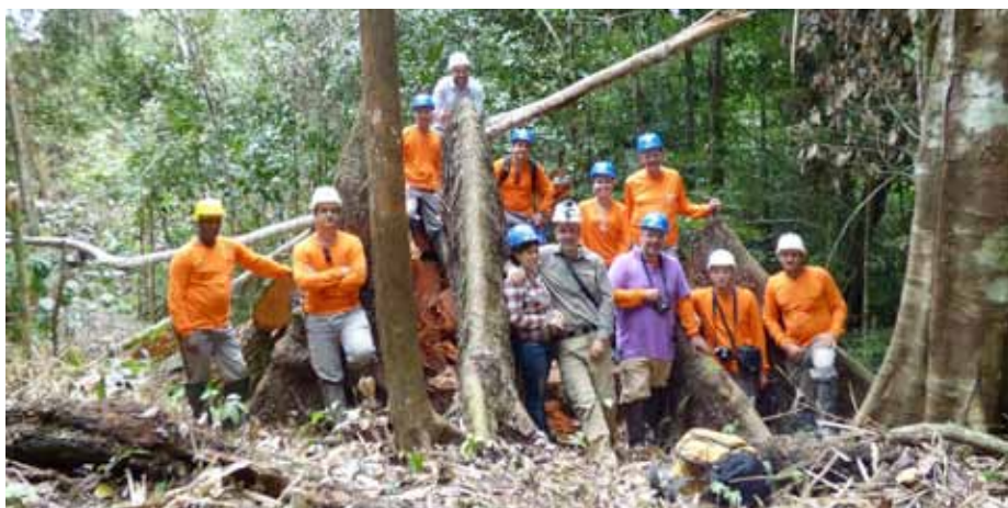
Una brigada de campo junto a un tocón de caoba en la Fazenda Seringal Novo Macapá , estado de Acre, Brasil.

La caoba de hoja ancha ( Swietenia macrophylla ) en la Amazonia brasileña: estudios a largo plazo sobre su dinámica poblacional y la ecología de su regeneración con miras a su manejo forestal sostenible