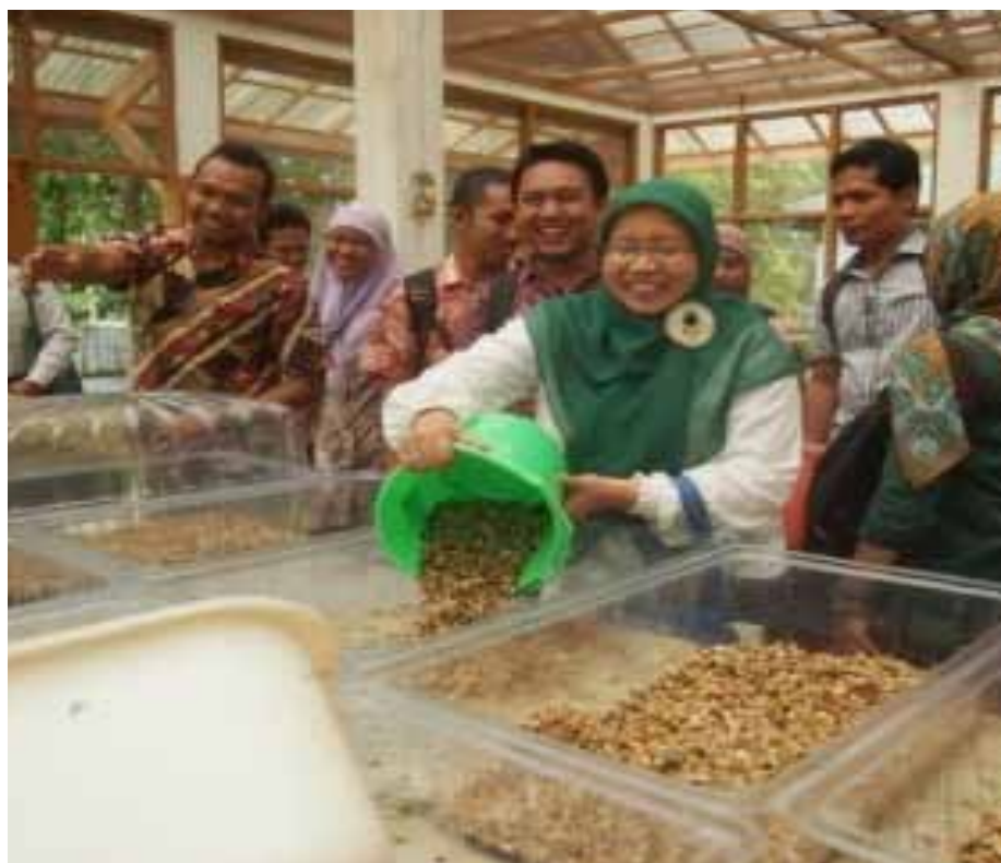
Práctica de técnicas de propagación vegetativa de ramin.

La ejecución de esta actividad se extendió hasta fines de marzo de 2015, cuando fue concluida. Durante los últimos meses de ejecución, se llevaron a cabo tareas de divulgación para promover una aplicación más amplia de la hoja de ruta del ramin, que incluyeron un taller en Pontianak (Kalimantan Occidental) del 25 al 29 de noviembre de 2014 y otro taller final en Jambi (Sumatra) del 15 al 19 de diciembre de 2014. Además, del 10 al 12 de diciembre de 2014, se celebró un taller en Banjarbaru (Kalimantan Sur) sobre técnicas de propagación vegetativa, al cual asistieron un total de 30 participantes de Kalimantan Sur y Central. El 26 de enero de 2015, se llevó a cabo en Bogor una consulta pública sobre la adopción de las directrices DENP para el ramin, que contó con la presencia de 40 participantes. El propósito de esta consulta era obtener aportes adicionales sobre las directrices DENP para el ramin.