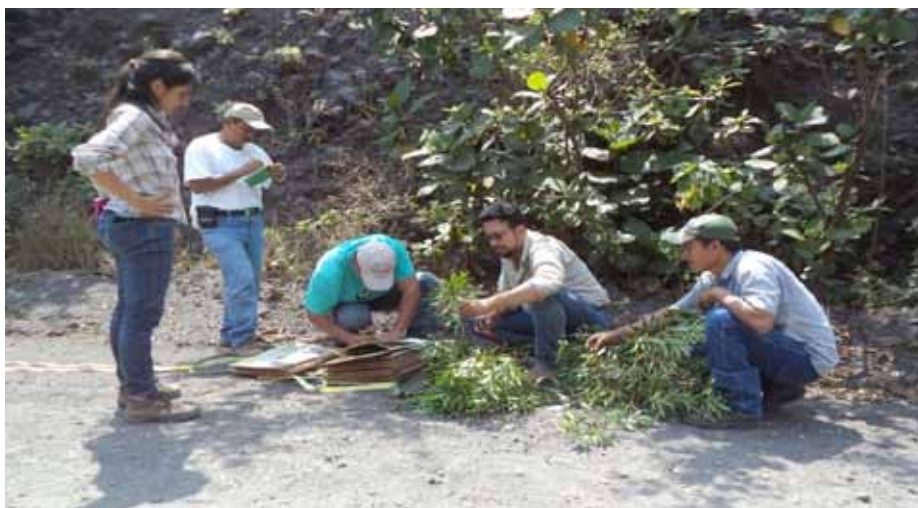
Recolección de muestras botánicas durante el inventario del género Dalbergia en Guatemala.

Con respecto al género Dalbergia , es necesario asegurar su protección y/o establecer directrices de manejo forestal sostenible a fin de garantizar la supervivencia de los bosques naturales, que son esenciales para mantener las fuentes semilleras y la propagación de semillas con características genéticas aceptables.