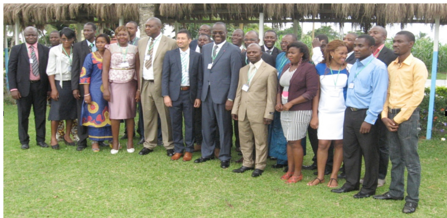
Les participants à l'Atelier de formation au prélèvement d'ADN de Pericopsis elata et à son extraction à Kribi (Cameroun) le 3 juin 2014.