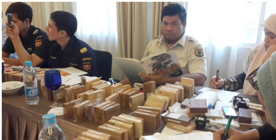
Lors de l'Atelier de formation organisé à Bogor (Indonésie) du 13 au 15 avril 2014, on a appris à identifier le bois de ramin et des bois d'aspect similaire à partir de spécimens.

Après révision, la période de mise en œuvre effective de cette Activité devrait s'achever en décembre 2014. Son objectif, qui est de contribuer à la saine gestion des plantations de bois d'agar, depuis leur création jusqu'à la production et au commerce, englobe également le bois d'agar produit par inoculation artificielle. Les deux principaux produits escomptés sont: i) des données sur les plantations, la production de bois d'agar et la qualité du bois obtenu d'espèces plantées sont recueillies; et ii) une politique nationale sur les plantations et la production de bois d'agar, y compris son potentiel marchand et son commerce, est proposée.