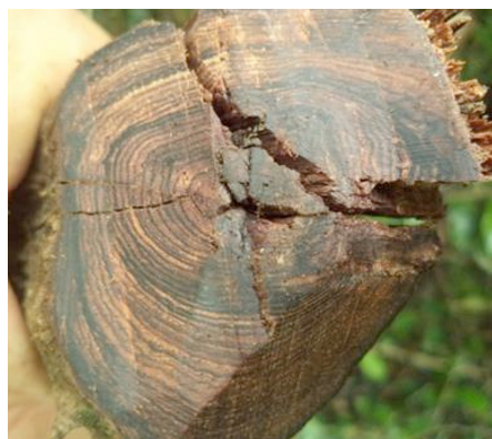
Caractéristiques d'un bois du genre Dalbergia .

Selon les recherches et les observations sur le terrain, les principaux facteurs expliquant