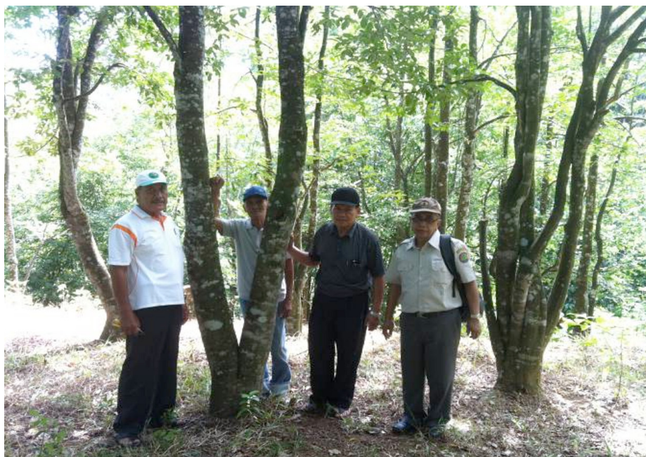
Une plantation d'arbres à bois d'agar d'un diamètre supérieur à 20 cm, prêts à être inoculés dans le nord de Sumatra (Indonésie).

1 041 à partir de semences et de sauvages pour les 3 354 restants. À cet égard, en juin 2014, une placette de 0,3 ha a été plantée d' A. malaccensis à intervalles de 3 m x 3 m dans la Forêt de recherche de Dramaga; et en juillet 2014, une placette de 0,25 ha plantée d' A. versteegii à intervalles de 2 m x 3 m, également dans la Forêt de recherche de Dramaga.