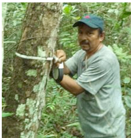
Mesurage d'un arbre du genre Dalbergia au Guatemala.

L'amenuisement de la population de Dalbergia seraient l'évolution des affectations des sols, le commerce illicite, les feux de forêt, l'agriculture traditionnelle, le manque de connaissances sur l'usage et la valeur de l'essence, etc. Les résultats de cette Activité permettront d'élaborer une stratégie qui définit et oriente les actions requises à court, moyen et long terme pour lutter contre les activités anthropiques qui mettent en péril les écosystèmes abritant l'espèce Dalbergia .