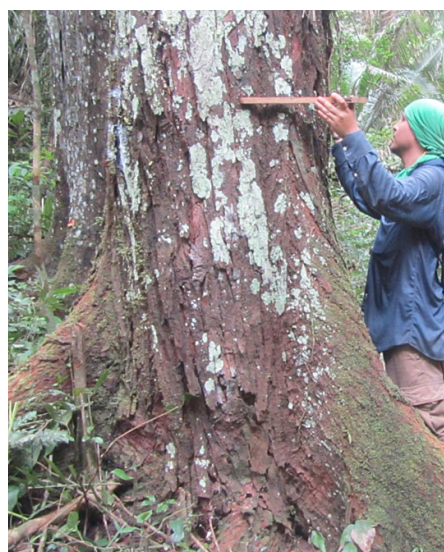
Mesurage du diamètre à hauteur d'homme (dhh) d'un acajou dans la concession forestière de Maderyja, Tahuamanu, Madre de Dios (Pérou).

Au titre des volets suivi et diffusion de l'Activité, se sont tenus les deuxième et troisième réunions du Comité consultatif en mai et juillet 2014, en présence respectivement du Ministère de l'environnement (MINAM), du Ministère de l'agriculture et de l'irrigation (MINAGRI), de l'Agence de supervision des ressources forestières et de la faune (OSINFOR) et de l'Assistance technique aux projets de l'USAID