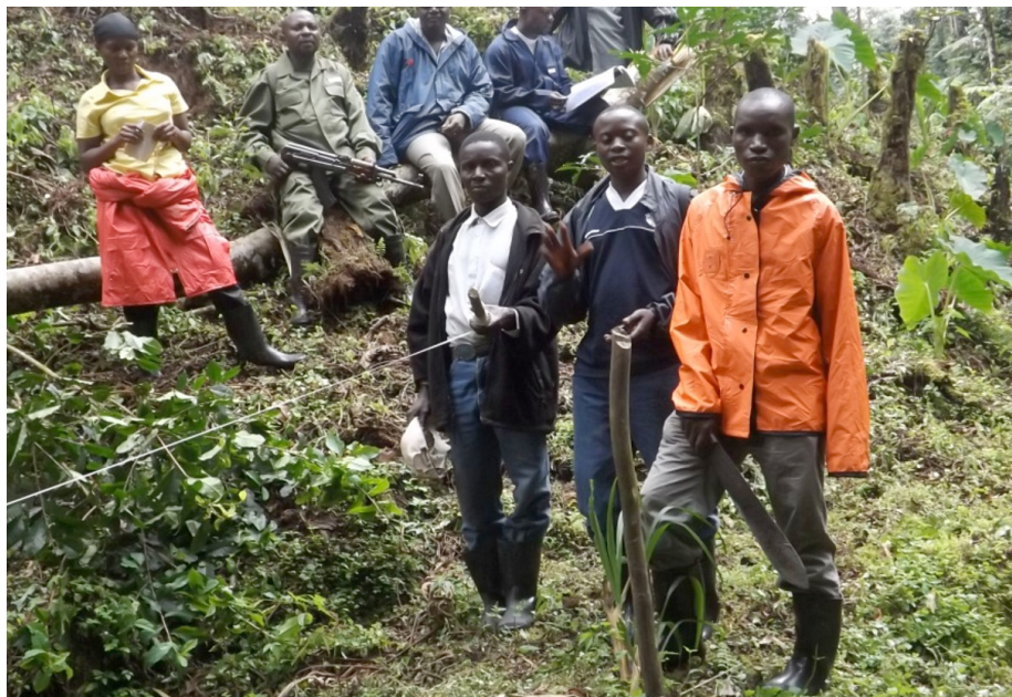
Des techniciens de terrain sont formés à mener des inventaires de Prunus africana dans la Réserve forestière de Kalikuku à Butembo (RDC) en mai 2014.

Au début de février 2014, l'ICCN a mené une mission destinée à renforcer les travaux exécutés par Phusys, le partenaire de la Maison Kahindo , l'une des sociétés de commerce locales, sur le territoire de Walikalé. L'ICCN a soumis à l'OIBT une feuille de route pratique conforme à la mission de suivi que le Coordonnateur régional pour l'Afrique avait menée vers la fin de 2013. L'OIBT a décaissé la dernière tranche des fonds qui permettront à l'ICCN de renforcer et de suivre les inventaires menés par les sociétés de commerce, et également de mener des inventaires de Prunus dans le Parc national de Kahuzi-Biega. Du 25 avril au 3 mai 2014, l'ICCN, le Centre d'information et de promotion des projets agricoles (CIPAGRI) et les deux plus grandes entreprises de commerce locales ont organisé un second atelier de formation à Butembo, dans le Nord-Kivu. Les participants y ont été formés à l'exécution des inventaires de Prunus . Le Coordonnateur régional a prêté son assistance à cet atelier de formation. Suite à cet atelier, le CIPAGRI a mis au point un modèle d'échantillonnage pour les inventaires de Prunus dans deux principales zones du Nord-Kivu, dont Mbakira, Masuli et Vusigha, qui couvrent 10 000 ha au total, et Kiribata, qui s'étend sur 1 700 ha. Le Coordonnateur