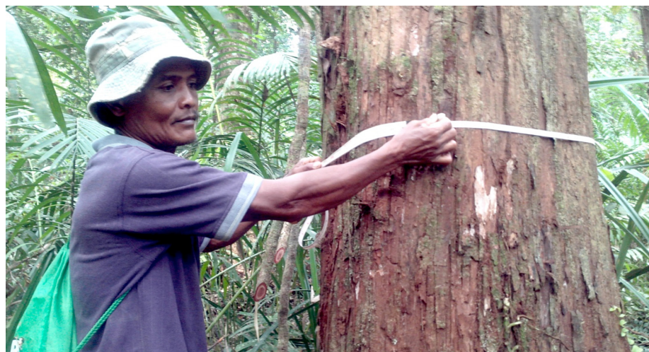
Vérification au sol de la répartition du ramin avec la participation des populations locales.

Le recueil d'informations autres que spatiales sur le ramin et le karas, intéressant par exemple la phénologie et l'habitat, dans les livres, revues et publications pertinents est terminé. Sur la base des informations contenues dans l'herbier du FRIM et autres documents publiés sur la répartition du ramin et du karas, plusieurs sites