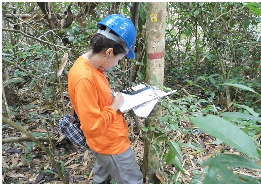
Une étudiante de maîtrise scientifique effectue des mesures dans une placette d'échantillonnage permanente dans la Fazenda Seringal Novo Macapá.

Au terme de l'Activité, la situation envisagée est la suivante: grâce à la valorisation des savoir-faire et de l'expertise du personnel du FDPM, la gestion durable et la conservation de l'espèce Aquilaria seront assurées. L'Accord de projet est aujourd'hui entre les mains du Gouvernement de la Malaisie, qui devrait le signer prochainement.