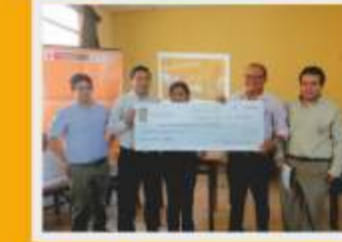
Entrega de fondos para proyecto PAES

Este material de difusión se ha elaborado en el marco del proyecto: "Fortalecimiento de la Conservación de la Biodiversidad, a través del Programa Nacional de las Áreas Naturales Protegidas-PRONANP".