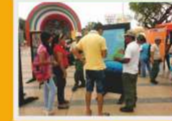
Actividades de difusión de la biodiversidad del PNCA