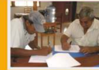
Firma de convenios para proyectos PAES

Se ha fortalecido 5 comunidades asentadas en la zona de amortiguamiento del Parque Nacional Cerros de Amotape, con la implementación de Proyectos Productivos a través del Programa de Actividades Económicas Sostenibles (PAES).