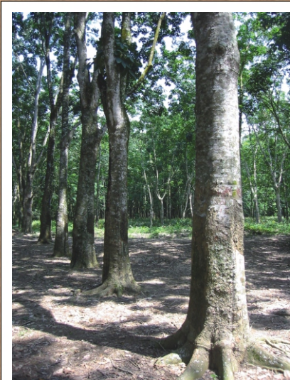
Portada: Plantación de caucho en Malasia.

El proyecto pd 46/99 rev. 3 (i) Análisis de prefactibilidad para el aprovechamiento industrial De la madera de caucho Hevea brasiliensis Incluyendo la formulación para la implementación de un caso Piloto en una zona específica de colombia se inició en diciembre de 2002 y concluyó en junio de 2004 dentro del marco del Convenio suscrito entre el Ministerio de Ambiente, Vivienda y Desarrollo Territorial de Colombia y la Organización Internacional de las Maderas Tropicales, OIMT.