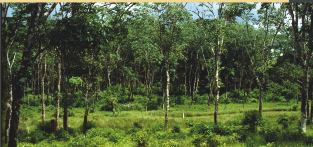
CUADRO A2.13 ÁREA SEMBRADA EN CAUCHO EN EL TOLIMA EN HECTÁREAS 1988 -1999