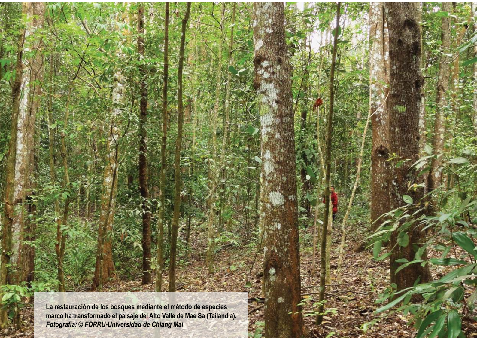
La restauración de los bosques mediante el método de especies marco ha transformado el paisaje del Alto Valle de Mae Sa (Tailandia).