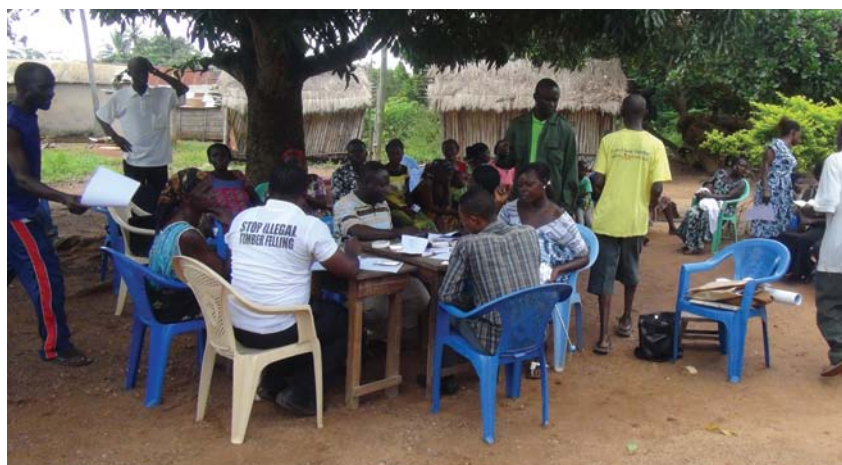
Recolección de datos personales de los agricultores para un acuerdo de distribución de beneficios en una plantación comunitaria, Distrito de Offinso (Ghana).

La RPF en las directrices se define como un proceso continuo de recuperación de la función ecológica y mejora del bienestar humano en los paisajes forestales degradados y deforestados. El proceso comprende tres elementos fundamentales: 1) participación; 2) manejo adaptativo; y 3) un marco coherente de seguimiento y aprendizaje.