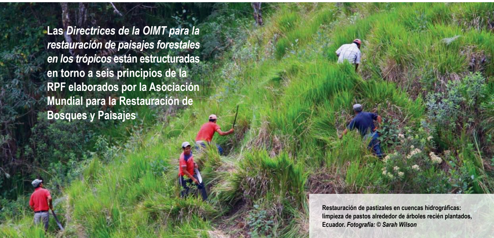
Restauración de pastizales en cuencas hidrográficas: limpieza de pastos alrededor de árboles recién plantados, Ecuador.

Las Directrices de la OIMT para la restauración de paisajes forestales en los trópicos están estructuradas en torno a seis principios de la RPF elaborados por la Asociación Mundial para la Restauración de Bosques y Paisajes