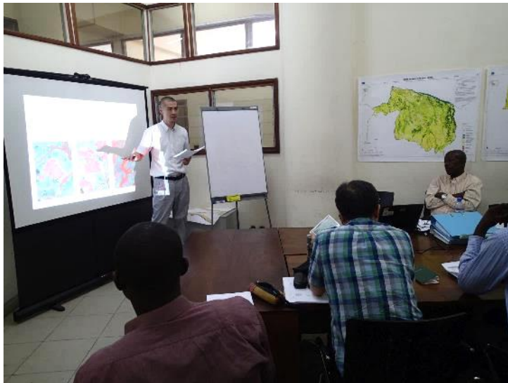
Democratic Republic of Congo コンゴ民主共和国