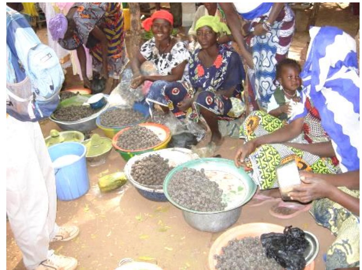
Burkina Faso ブルキナソ