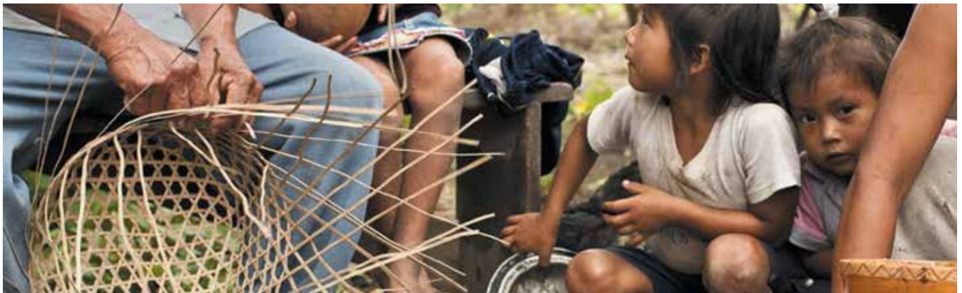
Pueblo Shuar del Ecuador.