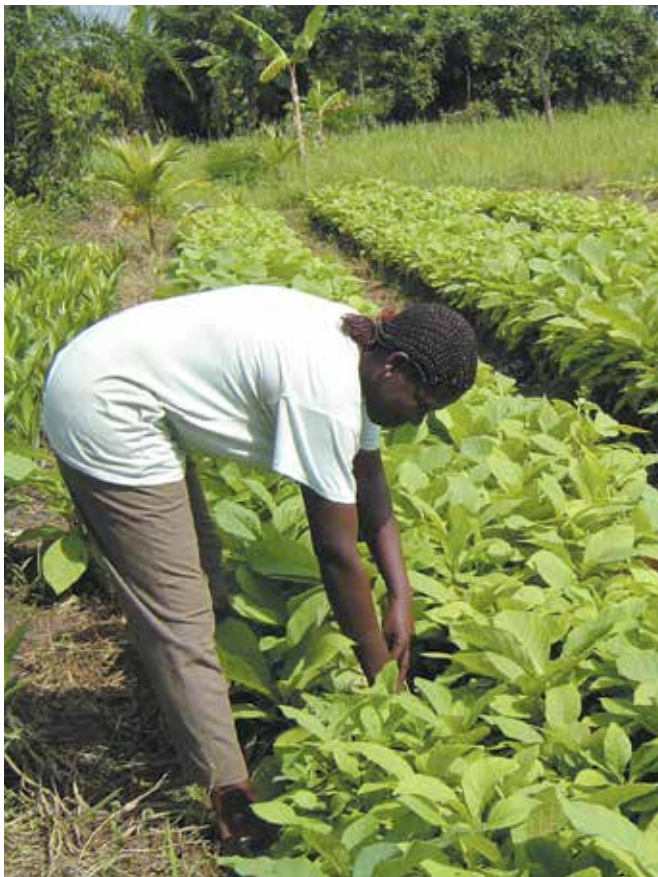
Vivero establecido por un grupo de mujeres para restaurar tierras forestales degradadas en la región del Volta.

A TRAVÉS DE TREINTA AÑOS DE EXPERIENCIA, LA OIMT HA CREADO MÉTODOS INNOVADORES Y EFICACES PARA EL DESARROLLO DE CAPACIDADES Y HA DIFUNDIDO INFORMACIÓN TÉCNICA VITAL E IMPORTANTES ENSEÑANZAS APRENDIDAS EN MATERIA DE EMPRESAS FORESTALES COMUNITARIAS (EFC).