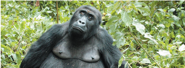
Un gorila del Parque Nacional de Kahuzi-Biega, República Democrática del Congo.

EL TRABAJO DE LA OIMT CONTRIBUYÓ A AUMENTAR EN UN 50% LA SUPERFICIE DE BOSQUES TROPICALES BAJO MANEJO SOSTENIBLE ENTRE 2005 Y 2010.