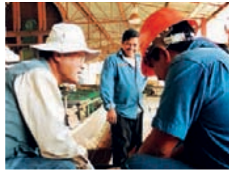
Ayudar a los miembros a participar en la transferencia de conocimientos y tecnologías, en particular, mediante la cooperación Sur-Sur y Norte-Sur.