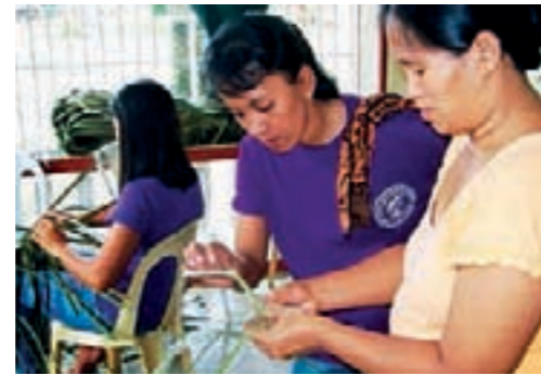
Ayudar a las comunidades y empresas forestales a desarrollar sus capacidades empresariales y comerciales, inclusive en materia de estrategias de comercialización.