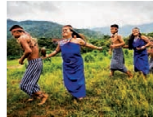
Fomentar la cooperación regional y transfronteriza para la conservación de la biodiversidad y la producción sostenible de madera.