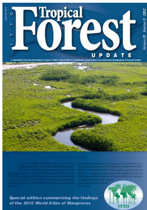
Carátula del resumen del atlas, Actualidad Forestal Tropical (AFT) 21(2), 2012