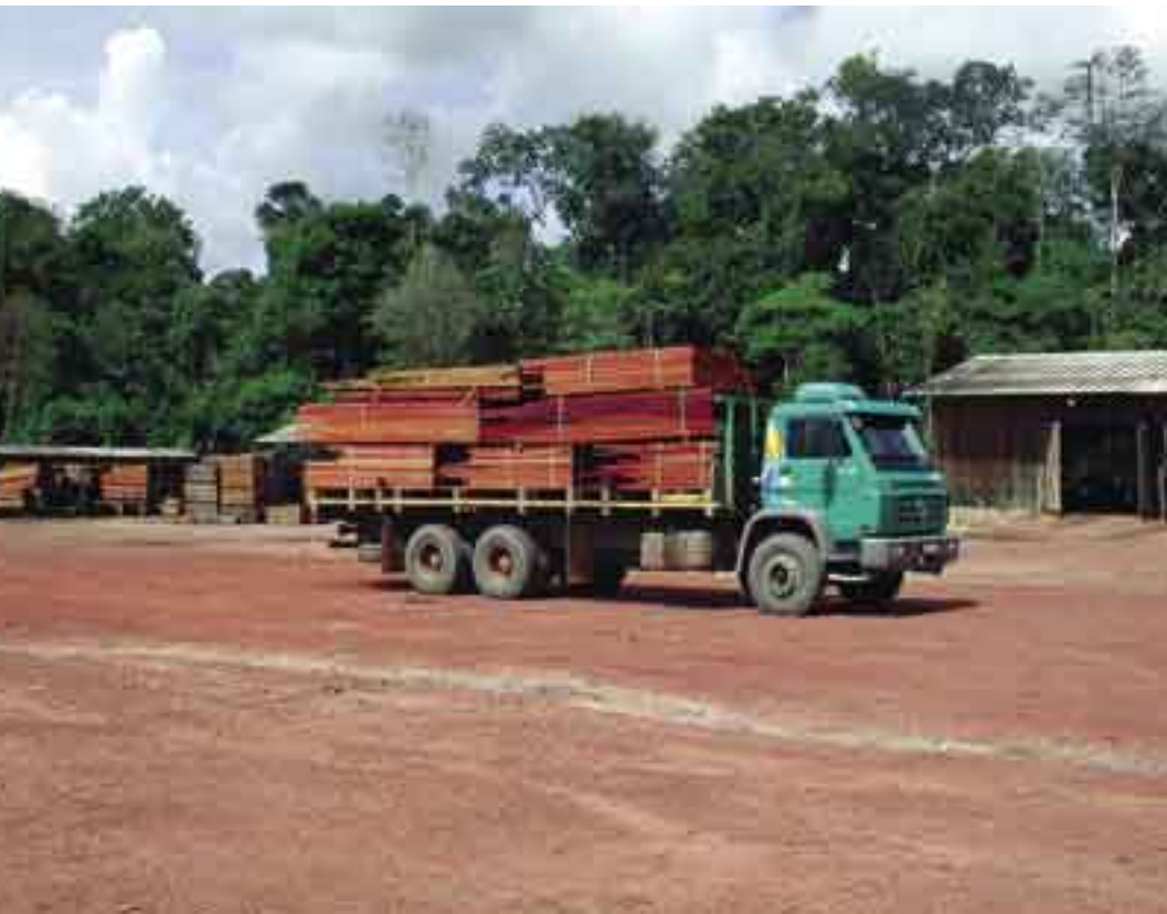
Mayor control: la misión de diagnóstico recomendó un control más estricto de la planificación del manejo forestal, la extracción maderera y el transporte a fin de aumentar el riesgo de las operaciones ilegales y mejorar la imagen de la madera extraída legalmente, como la carga de caoba brasileña transportada por este camión.

para el gobierno, sino que es un programa que deben ejecutar conjuntamente todos los actores clave.