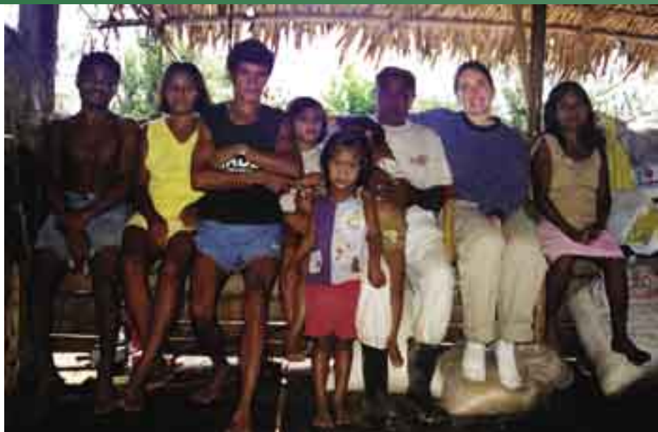
In situ: la autora (segunda desde la derecha) con un grupo de pobladores amazónicos durante las actividades de verificación en el terreno.

En el presente artículo presento las metodologías utilizadas para el cartografiado de bosques tropicales y expongo su utilidad y sus limitaciones. En el estudio se emplearon dos métodos diferentes: la interpretación de imágenes de LANDSAT TM y una clasificación florística de los tipos de bosque basada en datos de un inventario forestal.