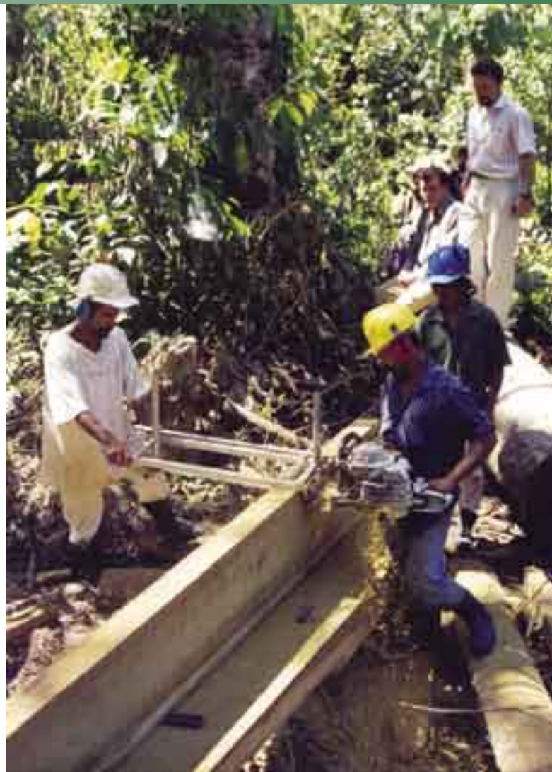
Un marco de acción: los funcionarios del proyecto estudian la practicabilidad y eficiencia de la motosierra con marco.

Las actividades e investigaciones referentes a estos objetivos se han desarrollado en los bosques comunales de Toncontín y Urraco, donde se están aplicando técnicas de aprovechamiento de impacto reducido, como la "motosierra con marco" para el tronzado primario de trozas en el bosque empleando motosierras y un "marco" móvil ( ver fotografía ), y la tala dirigida, que permiten un mayor rendimiento en la producción, mejor calidad de la madera y menor daño al suelo y a la vegetación. En particular,