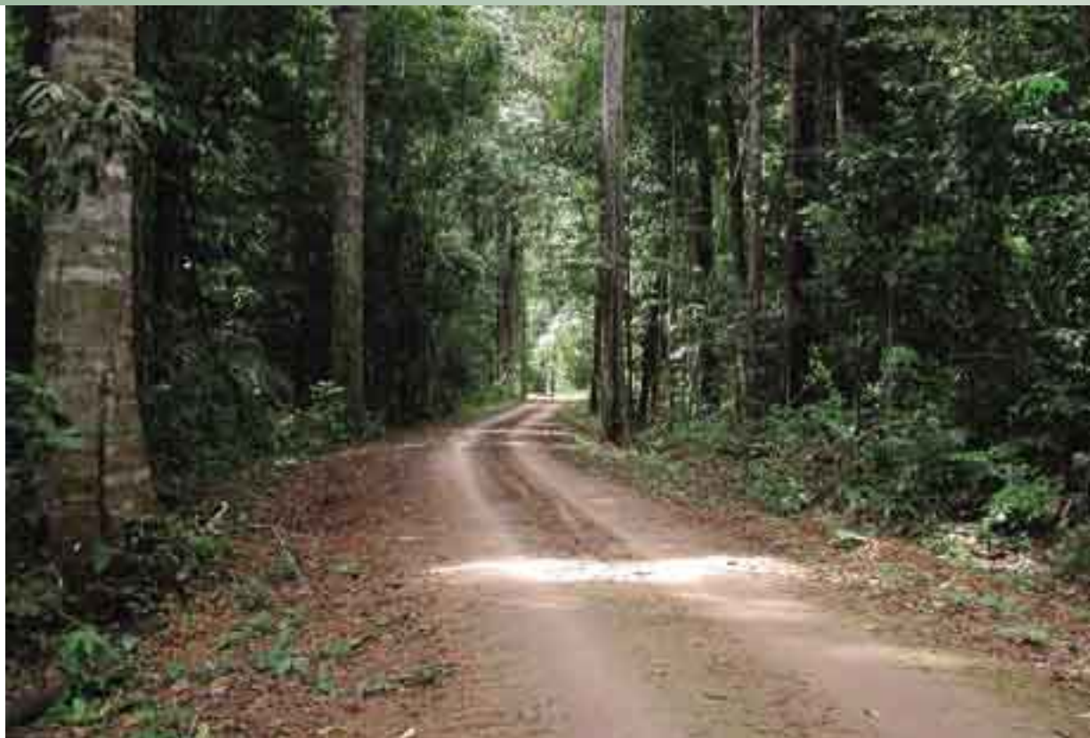
Aprobado: este camino forestal es parte de una concesión forestal certificada de Pando.

Casilla Postal 314 Cobija, Pando, Bolivia f 591-842 2763 panfor@entelnet.bo