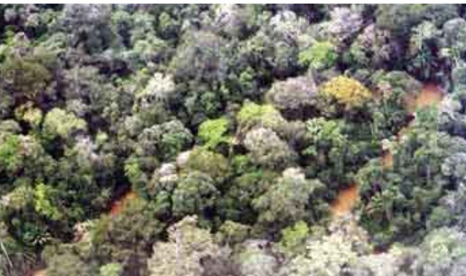
Mapa de barro: vista aérea de los bosques aluviales del estado amazónico de Acre.

Los resultados de los procesos de interpretación revelaron que la clasificación visual es el método más eficaz para diferenciar los tipos de bosque, con una precisión general del 89%. La clasificación digital supervisada no reconoció las diferencias entre clases espectrales, ya sea sobreestimando o clasificando erróneamente algunos tipos de bosque, produciendo un nivel bajo de precisión (60%). La clasificación no supervisada logró separar los principales fitodominios de bosque denso y bosque abierto (90% de precisión general), pero no reconoció los tipos de bosque dentro de estos dos dominios.