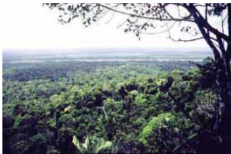
ガイアナ(南米)二酸化炭素を吸収するイオクラマの森