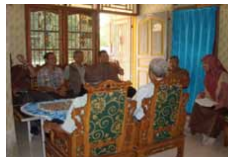
Debate sobre el complejo de producción de madera de agar con representantes de los grupos de productores.

La actividad concluyó en septiembre de 2015 con la finalización de todas las tareas programadas, a saber: (i) la documentación de información sobre la ecología reproductiva de A. malaccensis , incluido el análisis de datos sobre la fenología de la floración, desarrollo de yemas florales, madurez fisiológica, anthesis/receptividad, fructificación, y maduración y germinación de un total de 420 árboles en cinco poblaciones; (ii) la recopilación de información genética ecológica para la preparación de un plan de acción para la conservación de A. malaccensis en Malasia Peninsular, con el análisis de secuencias de ADN en 286 muestras y la genotipificación de microsatélites en 942 muestras de 35 poblaciones silvestres; y (iii) el desarrollo de bases de datos con perfiles de ADN para A. malaccensis en Malasia Peninsular para 942 individuos, 7 especies y 34 sitios con variaciones intraespecíficas para el rastreo de la madera y