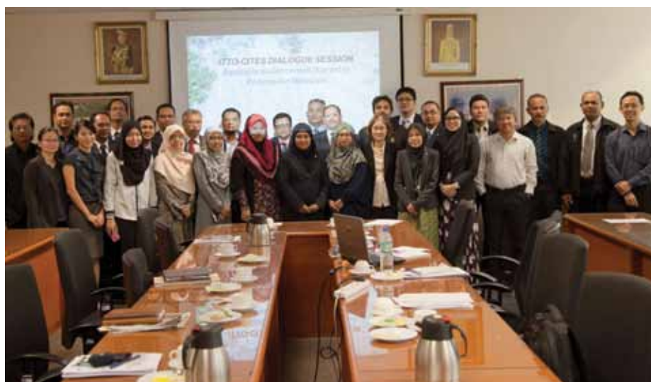
Participantes del diálogo de actores interesados llevado a cabo en el Ministerio de Ambiente y Recursos Naturales de Malasia en septiembre de 2015.

En la actualidad, se están preparando dos informes titulados "Bases de datos de perfiles de ADN de Aquilaria malaccensis (Thymelaeaceae) para la identificación de poblaciones e individuos" y "Plan de acción de conservación para la especie