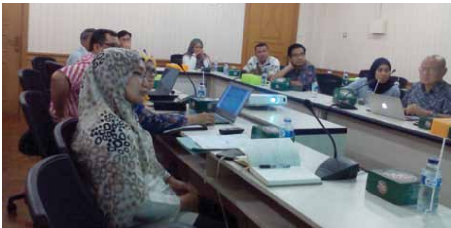
Reunión preparatoria para el desarrollo de un concepto de conservación de ramin en concesiones de plantaciones forestales.

Esta actividad tiene por objeto: (i) formular un concepto de conservación de ramin para las concesiones de plantaciones forestales; (ii) elaborar directrices de conservación de ramin para las concesiones de plantaciones forestales; y (iii) realizar un examen del Decreto N° 127/KPTS-V/2002 del Ministerio de Bosques sobre la "Moratoria provisional en las actividades de explotación y comercio de ramin".