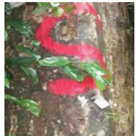
Marcado de un árbol madre para su retención en la unidad de manejo forestal GVI, al este de Camerún.

La ANAFOR organizó una reunión del Comité Científico en julio de 2015 con el objeto de examinar los diferentes informes presentados por los expertos. Se finalizaron cuatro de las nueve actividades específicas, a saber: (i) capacitación de campesinos forestales sobre la silvicultura de P. elata ; (ii) producción de 8.200 plántulas de P. elata para el establecimiento de plantaciones; (iii) estudios sobre los suelos y las propiedades edáficas de P. elata ; y (iv) estudios sobre las plagas y enfermedades de P. elata . La ANAFOR está organizando la segunda reunión del Comité Científico para fines de diciembre de 2015 a fin de examinar los informes presentados por los expertos sobre otras cuatro actividades específicas, a saber: (i) ensayo de diferentes diseños de