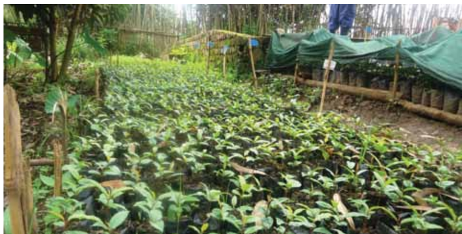
Plántulas de Prunus en un vivero para plantaciones de enriquecimiento en las sierras de Kateku y Ngambi en el territorio de Walikalé, Kivu Norte.

En mayo de 2015, la OIMT envió la segunda remesa de fondos y en julio/agosto, la Dirección a cargo de inventarios y gestión forestal del