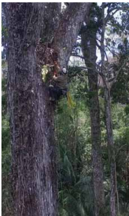
Fotografía aérea de árboles de caoba tomada con un drone y un trabajador colocando una cámara para la evaluación fenológica.

Organismo ejecutor: CIRAD, Francia Situación: En curso (componente TMT) Fecha de inicio: Octubre de 2013 Duración programada: 24 meses Duración a la fecha: 26 meses