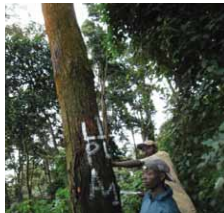
Marcado de un árbol explotable durante el inventario de explotación de Prunus en el bosque de Manguridjipa, Kivu Norte, RDC. Los símbolos marcados identifican claramente el árbol explotable (o un árbol con un diámetro a la altura del pecho de, por lo menos, 30 cm).

La finalización de esta actividad actualmente está prevista para marzo de 2016. Su objetivo es reunir datos sobre el estado de la especie Pericopsis elata en las concesiones forestales de la República Democrática del Congo (RDC). Las autoridades de la RDC prepararon satisfactoriamente el informe sobre dictámenes de extracción no perjudicial (DENP) para P. elata en mayo de 2014 según lo programado. El