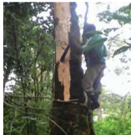
Extracción de corteza de Prunus africana en Monte Camerún.

Esta actividad, iniciada en junio de 2014, tiene como objetivo demostrar que con el uso de técnicas de análisis de ADN, es posible rastrear la corteza de Prunus africana hasta los árboles específicos de Unidades de Adjudicación de Prunus (UAP) controladas. Después del taller de capacitación organizado en Kribi en junio de 2014, el equipo coordinador de Camerún envió estudiantes y técnicos al bosque para recolectar muestras de Prunus utilizando las técnicas enseñadas en el taller. Por consiguiente, los estudiantes comenzaron las actividades de recolección en las UAP en agosto de 2014 y las muestras recolectadas se enviaron al laboratorio de Double HELIX para su análisis. Posteriormente, los estudiantes volvieron al bosque y recolectaron muestras de Prunus en la parcela anual de Monte Camerún, así como en la unidad de