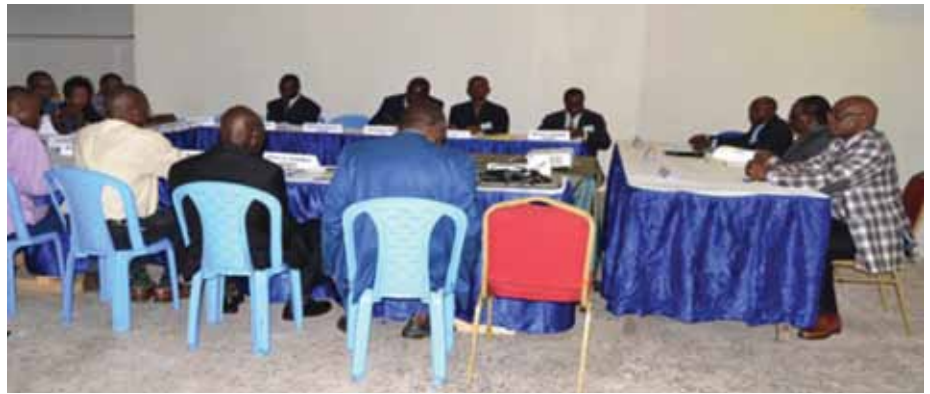
Reunión de validación de los informes de los expertos a cargo de elaborar la base de datos sobre la tala, transformación y comercio de P. elata en el Congo, Brazzaville, 1 de diciembre de 2015.

Del 12 al 19 de febrero de 2015, el Coordinador Regional (CR) de África supervisó el trabajo realizado en el terreno y observó que se habían plantado plántulas silvestres de P. elata en 5 hectáreas de bosque en la Unidad de Manejo Forestal de Tala Tala utilizando el método de plantaciones en línea. El CR propuso al equipo coordinador que adquiriera más semillas, estableciera un vivero de mayor envergadura y probara diferentes técnicas silvícolas. En agosto de 2015, los expertos presentaron sus informes finales sobre todos los trabajos realizados, los cuales fueron aprobados por el grupo científico de la actividad. Por último, se plantaron un total de 12 hectáreas de P. elata en zonas de concesiones forestales. Los informes finales de la actividad se presentarán a la OIMT a principios de 2016.