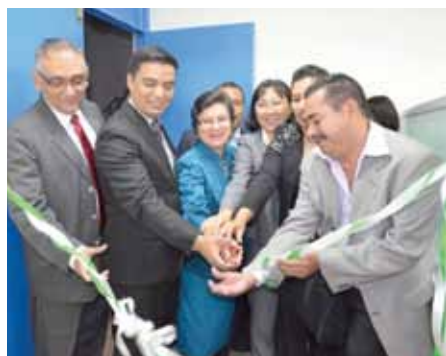
Ceremonia de corte de cinta para la inauguración oficial del Laboratorio Forense.

El objetivo de esta actividad es “proporcionar una orientación a las Autoridades CITES con respecto a los procesos, metodologías e información necesarios para formular dictámenes de extracción no perjudicial para especies maderables y otras especies de árboles no maderables”. Entre los resultados obtenidos a la fecha, se incluyen una compilación de la información disponible y análisis de las diferentes opciones para la elaboración de DENP, y la organización de una reunión de un grupo de expertos en Antigua, Guatemala, del 16 al 19 de septiembre de 2015.