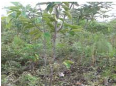
Variación morfológica en ramificaciones de ramín en Ogan Komering Ilir, Sumatra Sur.

de madera de agar tanto de bosques naturales como plantados, y (ii) la producción sostenible y conservación de sus recursos genéticos, así como aumentar la transparencia del comercio de productos de madera de agar.