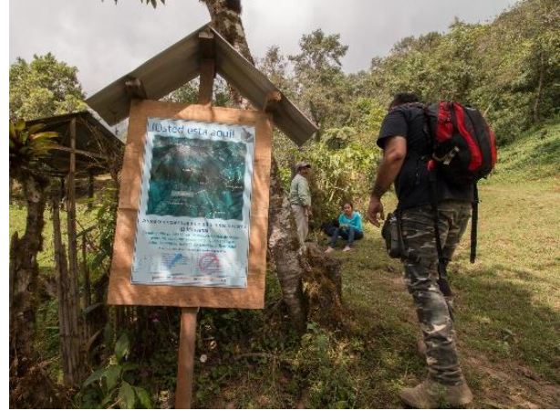
Señalética del Sendero Talquián - La Línea.

Se ha registrado ingresos máximos de hasta 5,160 visitantes al volcán Tacaná, con una afluencia mayoritaria proveniente de México. Algunos turistas especializados en montañismo y aviturismo puesto que el Pavo de Cacho se encuentra entre el Top 15 de especies raras y endémicas del mundo, y es altamente atractivo para los birdwatchers . Para el año 2017-2018, se proyecta una atención de 2,000 turistas a un costo global 8 de USD 85.0 por turista, proyectando ingresos estimados de USD 87,720.0. Ambas comunidades hicieron un aporte de contrapartida del 40% para el logro de estos resultados, movilizandando la acción colectiva y solidaridad en más de 50 familias organizadas para el turismo.