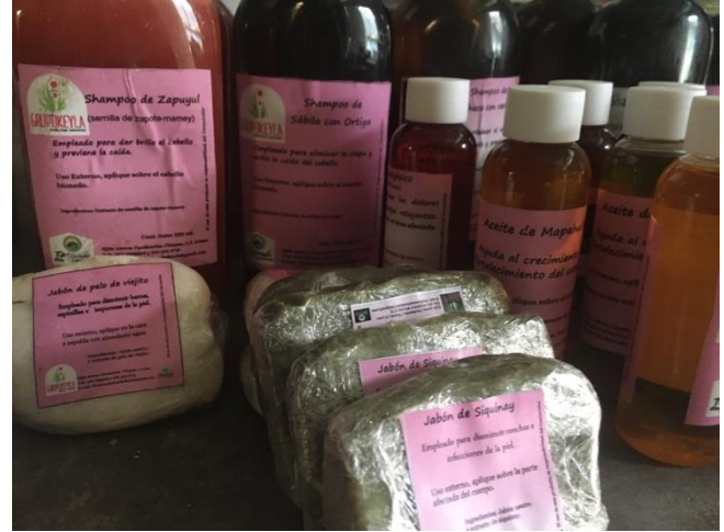
Detalle de los productos del Grupo Keyla.

El Proyecto refleja un VAN de $ 11,515.4 (USD 601.64) y una TIR DE 15.52%. El Grupo Keyla solo recibió el 35% de su proyecto inicial con el proyecto Tacaná, luego de la suspensión sus costos y apoyo fue financiado a través del Ayuntamiento de Cacahoatán se apoyó económicamente con $ 30,000.00 mexicanos (USD 1,567.4) y la Comisión Nacional de Áreas Naturales Protegidas CONANP. Con el financiamiento se apoyó dos etapas de este emprendimiento: i) la construcción del laboratorio de producción con $ 57,000 pesos (USD 2,978.05) en el año 2014 y ii) capacitaciones y conformación legal de la Sociedad Cooperativa en el año 2015 con un aporte de $ 40,000 (USD 2,089.86). Grupo Keyla es una cadena de valor ejemplar que merece más atención a futuro.