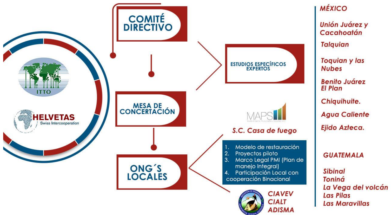
Figura 2. Modelo de intervención del proyecto.

En ambos países decidimos hacer una estrategia de re-ingreso al territorio lo más neutral posible, de allí que ADAFIS y MAPS no trabajarían desde los gobiernos municipales, sino que entrarían directamente a entablar comunicación con las comunidades. Afortunadamente todas las iniciativas productivas habían tenido un proceso de empoderamiento bastante informado y los beneficiarios estuvieron de acuerdo en retomar todas las iniciativas planificadas previamente (a excepción de una por estar a contratiempo).