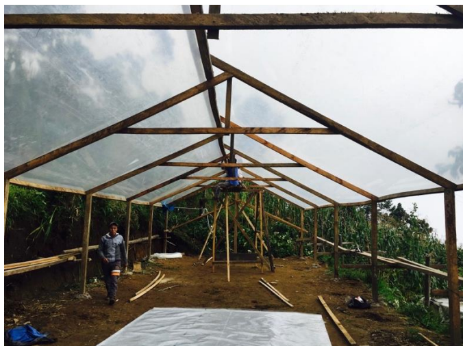
Construcción de invernaderos Toniná.