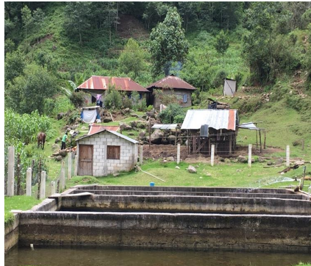
Vista de las piletas de crianza de trucha, Vega del Volcán