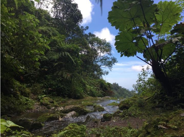
Restauración en Benito Juárez el Plan. México

Es importante mencionar que las acciones de producción de plántula de viveros en Guatemala estuvieron a cargo de mujeres organizadas en las comunidades de Vega del Volcán, Las Pilas y Canjulá. En México las tareas de restauración fueron desarrolladas por AMOPAV quien trabajó en cooperación con MAPS; gracias al financiamiento Programa de Conservación de Especies en Riesgo (PROCER) de la CONANP, desarrollando las acciones sin interrupciones y estableciendo cuatro viveros locales (Agua Caliente, Benito Juárez el Plan, Benito Juárez Montecristo, Toquián y las Nubes), produciendo planta de especies nativas, para utilizarse en la implementación de modelos de restauración.