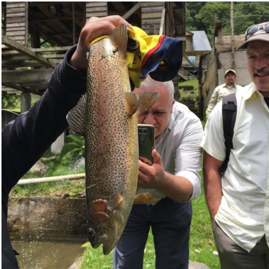
Reproductor de trucha, Vega del Volcán

Producción de Trucha Arcoiris ( Oncorhynchus mykiss Walbaum 1792) Cooperativa Vega del Volcán - CIAVEV, Guatemala: Se establecieron 14 estanques para la producción de 7,000 libras de trucha; los beneficiarios y productores: 4 mujeres y 10 hombres, esto significo para CIAVEV una duplicación de su capacidad productiva actual, es decir van a producir el 100% de lo que actualmente producen. CIAVEV es una cooperativa que tiene experiencia de más de 8 años de trabajo produciendo trucha; sus inicios incluyeron el desarrollo de capacidades en todo el ciclo de producción, desde los alevines hasta los adultos, saben elegir a las hembras reproductoras, tienen incubadoras para alevines y saben construir sus sistemas de captación de agua de manantial (del bosque contiguo) y saben construir las piletas de cultivo. Debido a que el proyecto fue completamente manejado por ellos por medio de un Convenio y Contrato de Cooperación con ADAFIS el socio local, ellos fueron capaces de fortalecer sus capacidades técnicas y administrativas, aprender a rendir cuentas por medio de informes y a resolver todo el tema de transparencia, incluyendo hasta un 40% de contrapartida en efectivo y en especie.