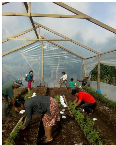
Siembra de vástagos - patrón de rosas, Toniná.

El análisis financiero establece una TIR de 52% y un VAN de Q 99,990.24 (USD 13,604.11). El proyecto de invernaderos genera autoempleo e ingresos económicos con un margen de ganancia superior a todas las iniciativas productivas financiadas en el proyecto. Por otra parte, se fortalece el intercambio comercial con poblaciones vecinas de México; en muchos casos, los productores de rosa adquieren puestos de venta en las ciudades mexicanas para agregar valor y vender su producto en forma de arreglos florales con lo cual incrementan sus ganancias.