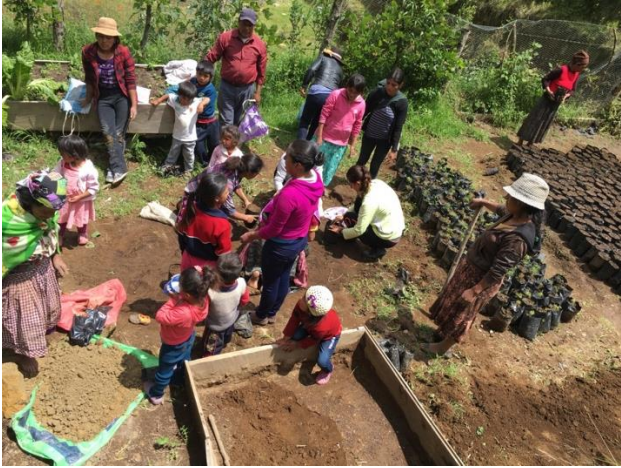
Vivero de mujeres, Aldea Vega del volcán Guatemala.

También se acompañó el establecimiento de 113.10 hectáreas de bosque con la modalidad de Planes de Conservación Forestal, como parte de los incentivos forestales que administra el INAB y CONAFOR y como acciones financiadas por el Programa de Conservación de Especies en Riesgo PROCER-CONANP y el ingreso de 5 nuevos expedientes en 2017 para conservación ante el INAB-Guatemala por 33 Ha (pago de Q2,850-USD390.41/año durante 10 años), haciendo un total de 195.31 hectáreas con modelos locales de restauración, conservación y reforestación de bosques en ambos países.