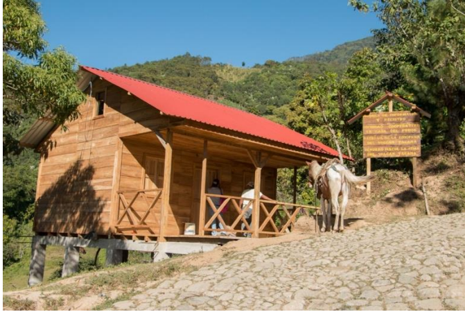
Centro de visitantes Talquián, México.