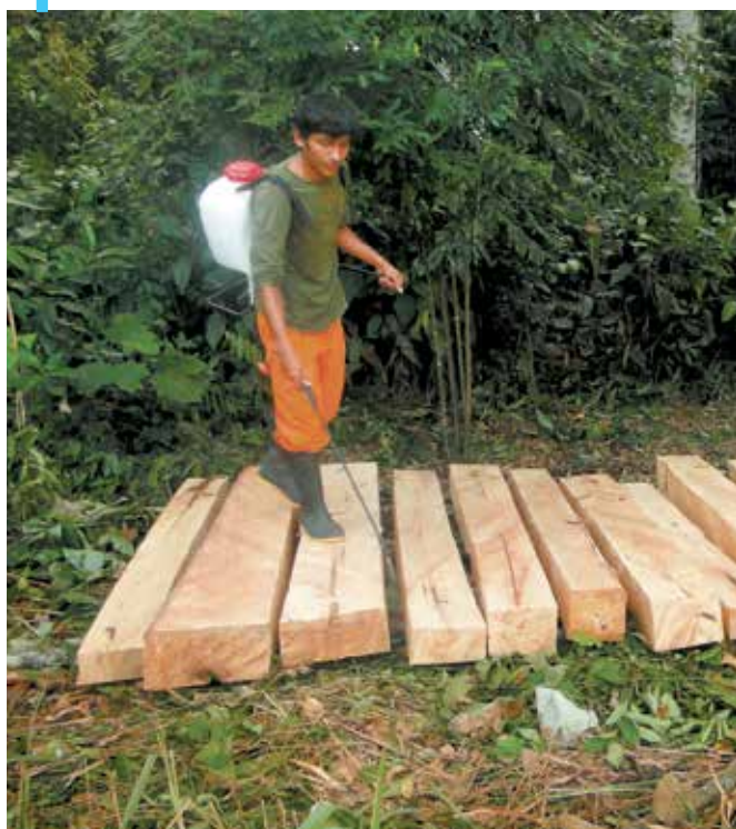
Tratamiento de madera, Ucayali, Perú.