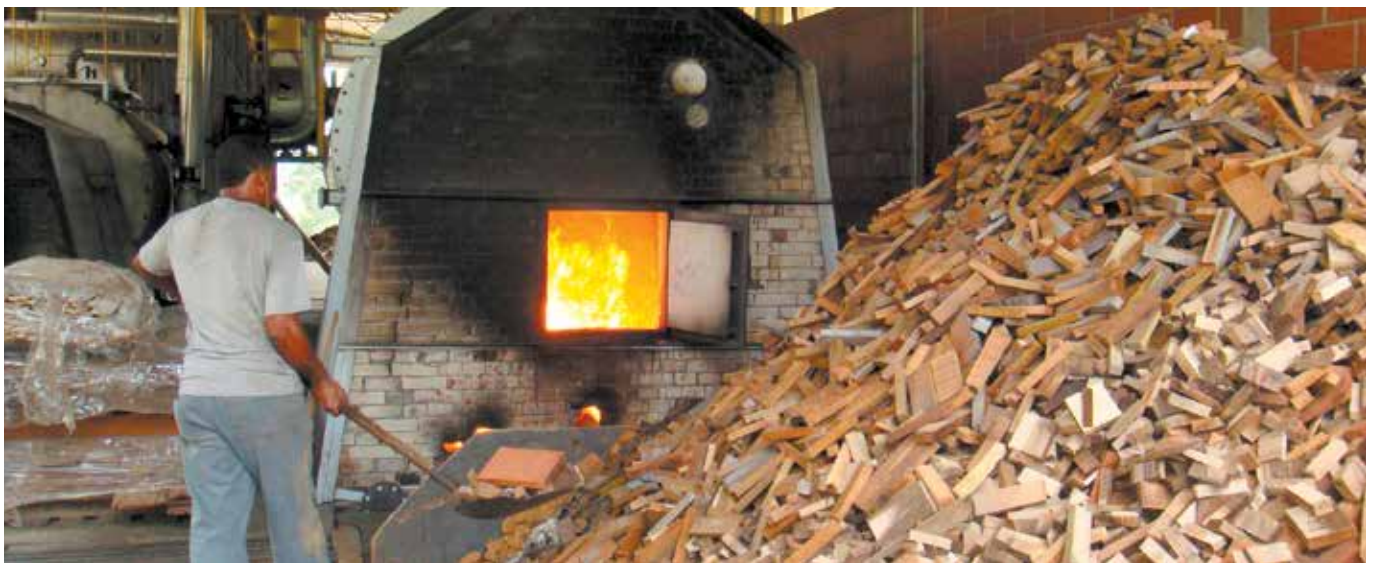
Generación de bioenergía a partir de residuos madereros, Brasil.