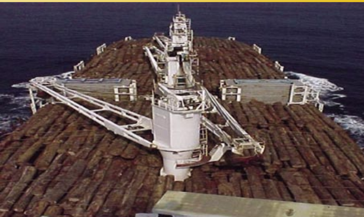
Chargement embarqué: Grumier en haute mer.

Une nouvelle étude publiée par l'OIBT explore le transport international des produits de bois tropicaux. Cette étude avait pour objectif d'examiner les processus et les problèmes liés au transport international des produits de bois tropicaux et de cerner les lacunes potentielles de la filière commerciale susceptibles d'occulter des activités illégales.