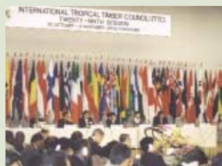
La OIMT: una mancomunidad de países forjando alianzas de cooperación

Muchos países han designado zonas de bosque permanente y algunos han garantizado derechos de tenencia para las comunidades que dependen de los bosques para su subsistencia. Este hecho, combinado con una mayor ejecución de políticas forestales a nivel local, está permitiendo una mayor participación de la comunidad en el manejo de los bosques públicos.