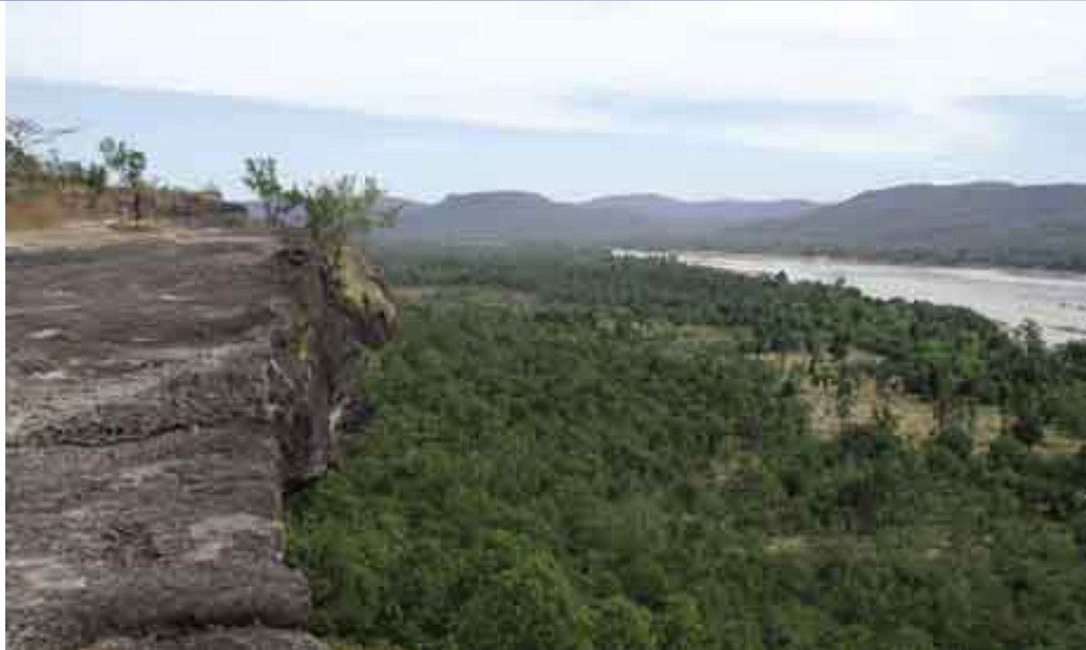
Panorama del río: el complejo de bosques de protección de Pha Taem, tema de un proyecto de la OIMT, tiene como límites al oriente el río Mekong y está formado principalmente por bosque de monzón.

EL COMPLEJO de bosques protegidos de Pha Taem (CBPP) ubicado en la provincia de Ubon Ratchathani al nordeste de Tailandia, cubre un área de unas 174.000 hectáreas y comprende cuatro áreas protegidas, los parques nacionales de Pha Taem, Kaengtana y Phu Jong y el refugio de fauna silvestre de Yot Dom y el refugio propuesto de fauna silvestre de Buntrik-Yot Mon ( ver el mapa y el cuadro ). El área presenta pendientes suaves hacia el sudeste y recibe las aguas del río Mekong, que forma la frontera entre Tailandia, Laos y Camboya. La zona de amortiguación de CBPP cuenta con 82 aldeas y una población de unos 89.000 habitantes, pero la CBPP presenta asentamientos humanos.