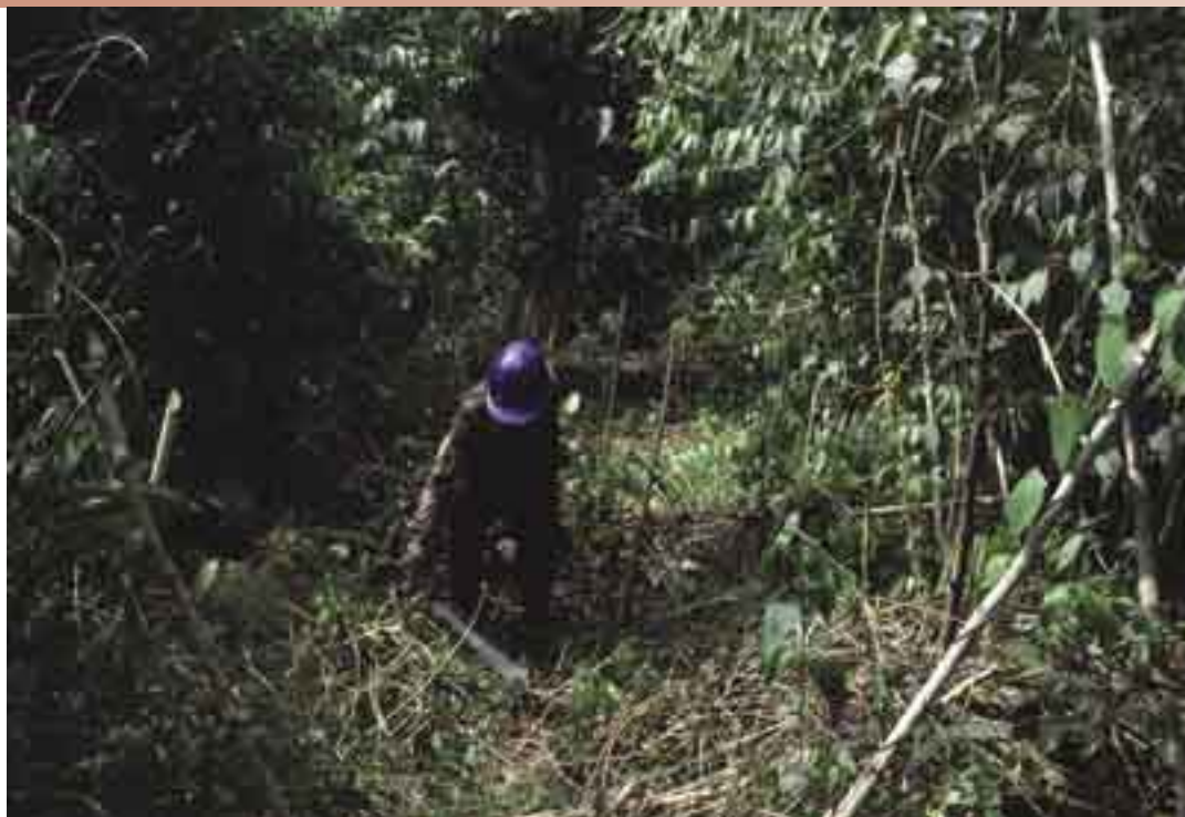
Esperanzas truncadas? Un trabajador corta las malezas a lo largo de la siembra de enriquecimiento en un bosque degradado por el fuego, en Kalimantan oriental. La siembra de enriquecimiento de los bosques tropicales no es una actividad aceptable bajo el Mecanismo de Desarrollo Limpio del Protocolo de Kioto.

las tierras asignadas para la producción maderera y la conservación forestal como parte de las propiedades forestales, con frecuencia se encuentran muy degradadas; en Cote d'Ivoire, por ejemplo, estas tierras cubren aproximadamente unos 1,5 millones de hectáreas. Un proyecto de la OIMT realizado hace más de dos décadas, estimó que casi 70 millones de hectáreas de bosques explotados en la región de Asia y el Pacífico, precisaban de rehabilitación. Como la tasa de degradación forestal continúa dejando a la zaga los esfuerzos de rehabilitación, el área de bosques degradados seguirá en aumento; es probable que a través de los trópicos alcance los cientos de millones de hectáreas. Sería relativamente fácil iniciar siembras de enriquecimiento en estas áreas degradadas y estas siembras ofrecen una forma de restauración de las funciones del bosque, contribuyen a la ordenación sostenible de los bosques y por tanto al desarrollo sostenible y al secuestro de grandes cantidades adicionales de carbono.